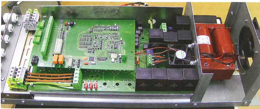
Der Prototyp der neuen Steuerung des Entwicklungsprojekts Neptun ist in marktkonformem Gehäuse eingebaut und steht für den Testlauf bereit.

tion von Frequenzumrichtern stammt. Unser Unternehmen ist innerhalb dieses Forschungsprojekts für die Industrialisierung und Fertigung sowie Vermarktung eines entsprechenden Produkts in der Schweiz zuständig.»