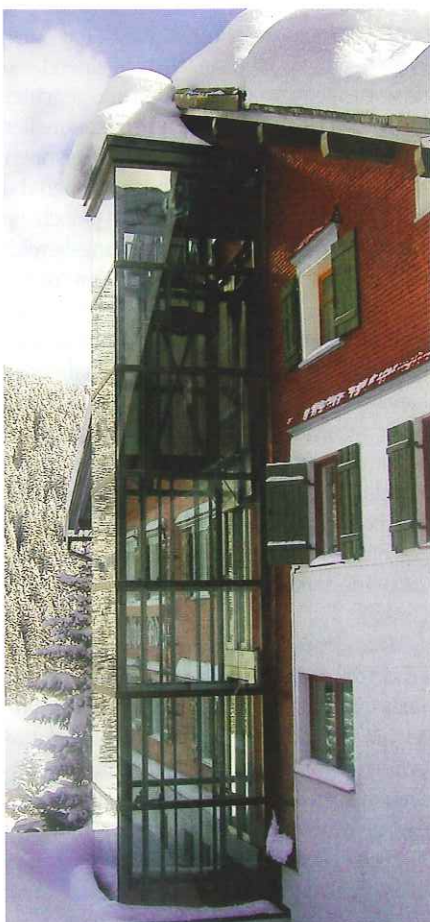
Die Mefortis AG ist seit über 30 Jahren im Aufzugssektor tätig und stellt neben Personenaufzügen und Panorama-Glasaufzügen auch Betten- und Behindertenaufzüge sowie Lasten- und Kleingüterlifte her.